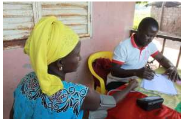
L'animatore durante una visita in un villaggio, nell'area sanitaria di Cossé, Bafatà

In particolare, l'equipe locale di salute è composta da un coordinatore, due responsabili, sedici operatori sociali, un autista e affiancata nelle quattro regioni di intervento dal personale diocesano e missionario locale. Negli ultimi mesi mi sono concentrata sulla figura dell'operatore sociale, qui chiamato animatore , e ne ho messo in evidenza le potenzialità. Gli animatori lavorano nelle Case delle Mamme, per donne con gravidanza a rischio, e nei Centri di Recupero Nutrizionale per bambini denutriti. Il loro impegno però è anzitutto quello di uscire dai centri e realizzare visite di monitoraggio nei villaggi più distanti, quelli che la Direzione Regionale di Salute ritiene più critici e vedere se ci sono gestanti a rischio o bambini in stato di denutrizione. Ho assistito più volte a queste visite e mi ha colpito la relazione positiva tra l'equipe e i capi villaggio e la fiducia riposta negli animatori e nei programmi della Caritas. "Per fare questo lavoro ci vuole molta umiltà", mi racconta un animatore, "Se vogliamo trasmettere un messaggio alla comunità, dobbiamo prima ascoltare e solo così possiamo instaurare un dialogo". Ecco, credo che questa sia la postura che la nascita di Gesù ci suggerisce: l'umiltà di un Dio bambino e l'ascolto della nostra condizione umana sono cammino di riconciliazione e salvezza.