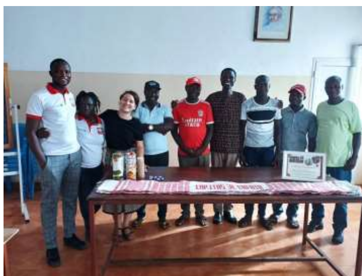
Con i colleghi in Caritas